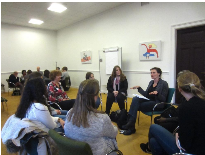
In de gespreksgroepen worden ervaringen uitgewisseld.