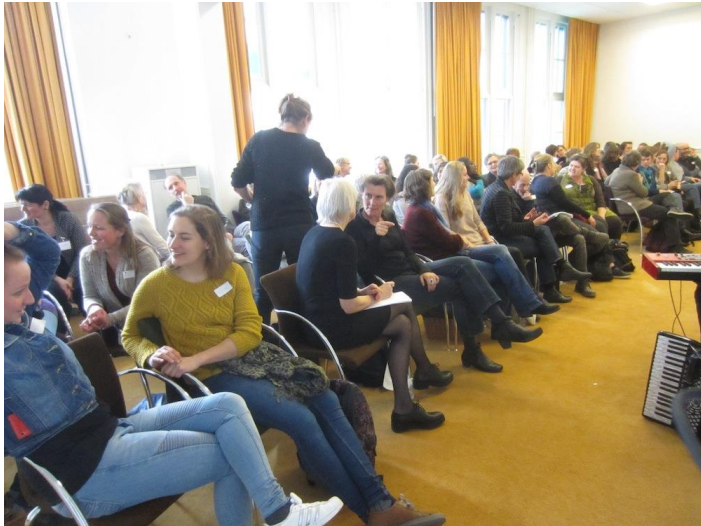
In gesprek met elkaar over de gespeelde scenes